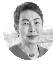
上野 千鶴子 氏 社会学者・東京大学 名誉教授・認定NPO 法人ウィメンズア クションネットワーク (WAN) 理事長