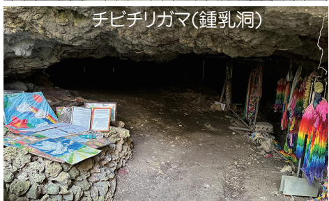
チビチリガマ(鍾乳洞)

神奈川県生協連では、全国の先進生協・地域などの事例に学び、今後の事業や活動に生かすことを目的に、会員生協役員による視察研修を毎年実施しています。2023年度は沖縄を訪問してきました。コープおきなわ あっふるタウン店見学、協同組合間連携、SDGs・障がい者雇用また、沖縄県生協連の平和について学びました。