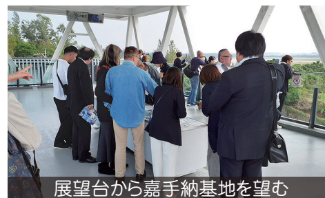
展望台から嘉手納基地を望む