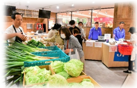
マルシェで出店の様子

同JAの担当者は「漁連との連携は今後も継続していきたいと考えている。マルシェだけでなく、商品開発などの新たな企画にもつなげたい」と話しました。