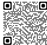
神奈川県協同健康保険組合 QRコード

神奈川県協同健康保険組合は健康保険に関する事業を運営する公法人です。被保険者や被扶養者の病気やけが、傷病による休業、出産、死亡等に対して、医療費の負担や各種給付金の支給や、病気の予防を目的とした各種健診、運動施設や保養施設の利用機会の提供等の「健康づくり」をサポートするための事業を行っています。詳しくは、同組織のホームページをご覧ください。 (https://www.kyodokenpo.or.jp/)