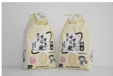
あつぎせせらぎ米