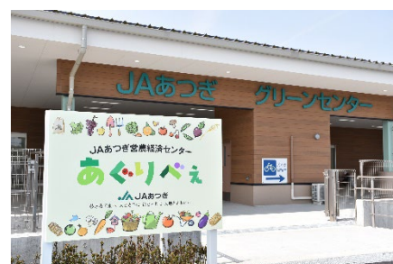
営農経済センター「あぐりべえ」