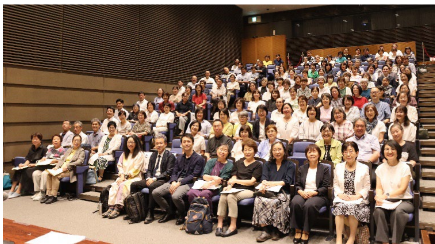
2024 年 7 月設立総会にはたくさんの方にご参加いただきました。