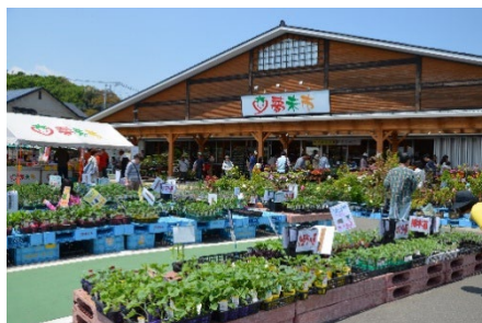
農産物直売所「夢未市」