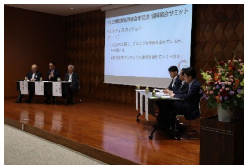
2025 国際協同組合年を記念した 「協同組合サミット」を開催