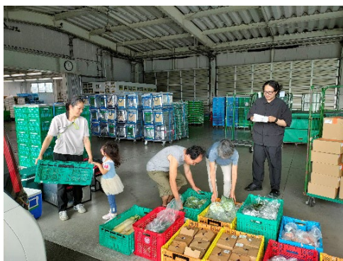
パルシステム神奈川の配送