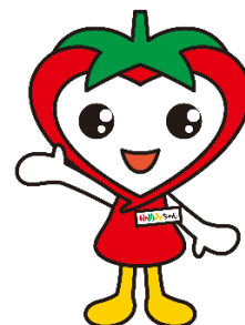
JAあつぎマスコットキャラクター ゆめみちゃん