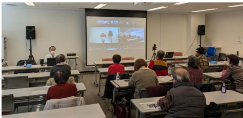
医療講演会「認知症の話」 Web参加もOKです！