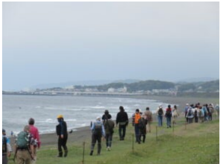
令和7年4月26日（土）の100キロウォークの模様（於：湘南海岸）