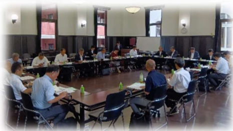
第3回神奈川県実行委員会の様子

「2025 年かながわ協同組合のつどい」や協同組合相互学習会(ワークショップ)、かながわC☺-ネットのロゴマークの募集について協議しました。